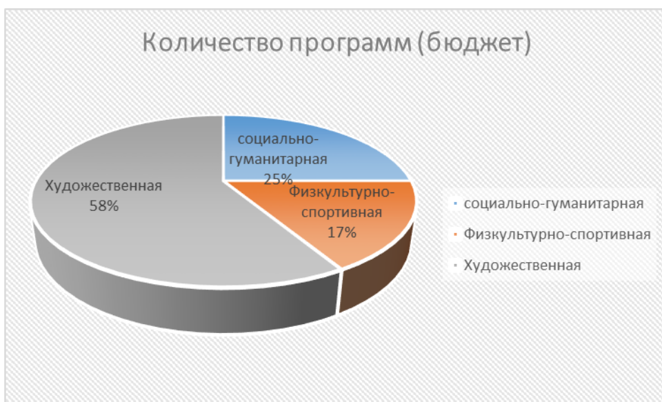
Таблица № 3